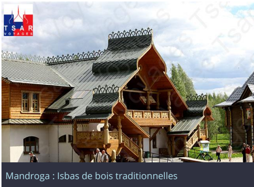
Mandroga : Isbas de bois traditionnelles