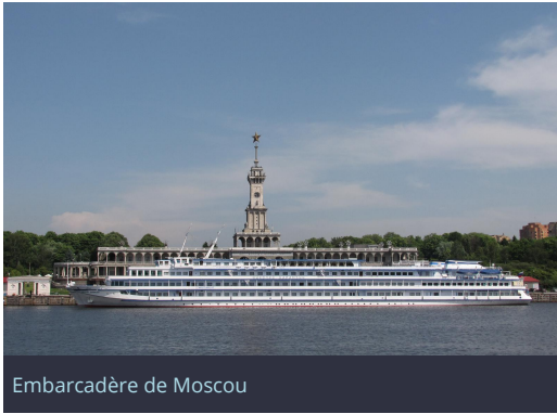
Embarcadère de Moscou