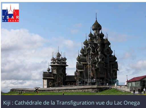
Kiji : Cathédrale de la Transfiguration vue du Lac Onega